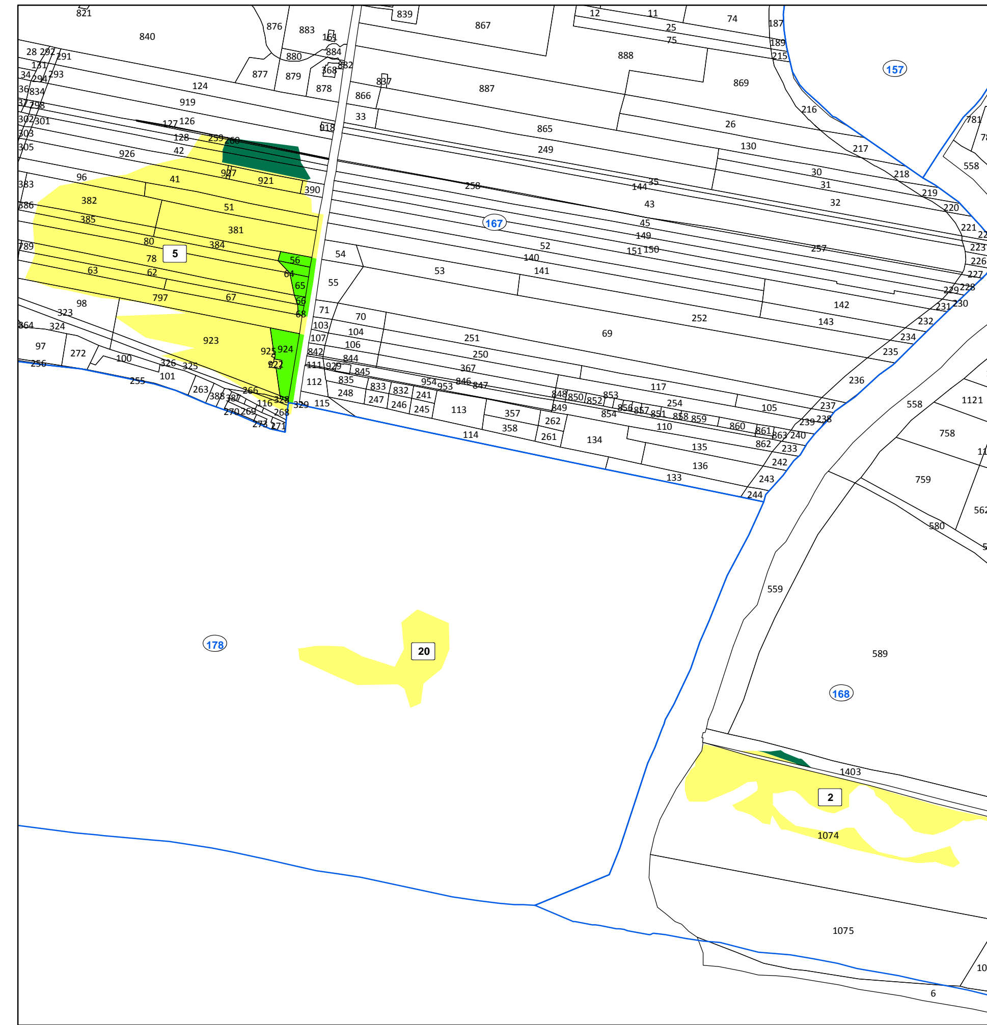
Area percorsa dal fuoco su catastale con vincoli ai sensi dell'art. 10 della L. 353/2000 - Scala 1:5000