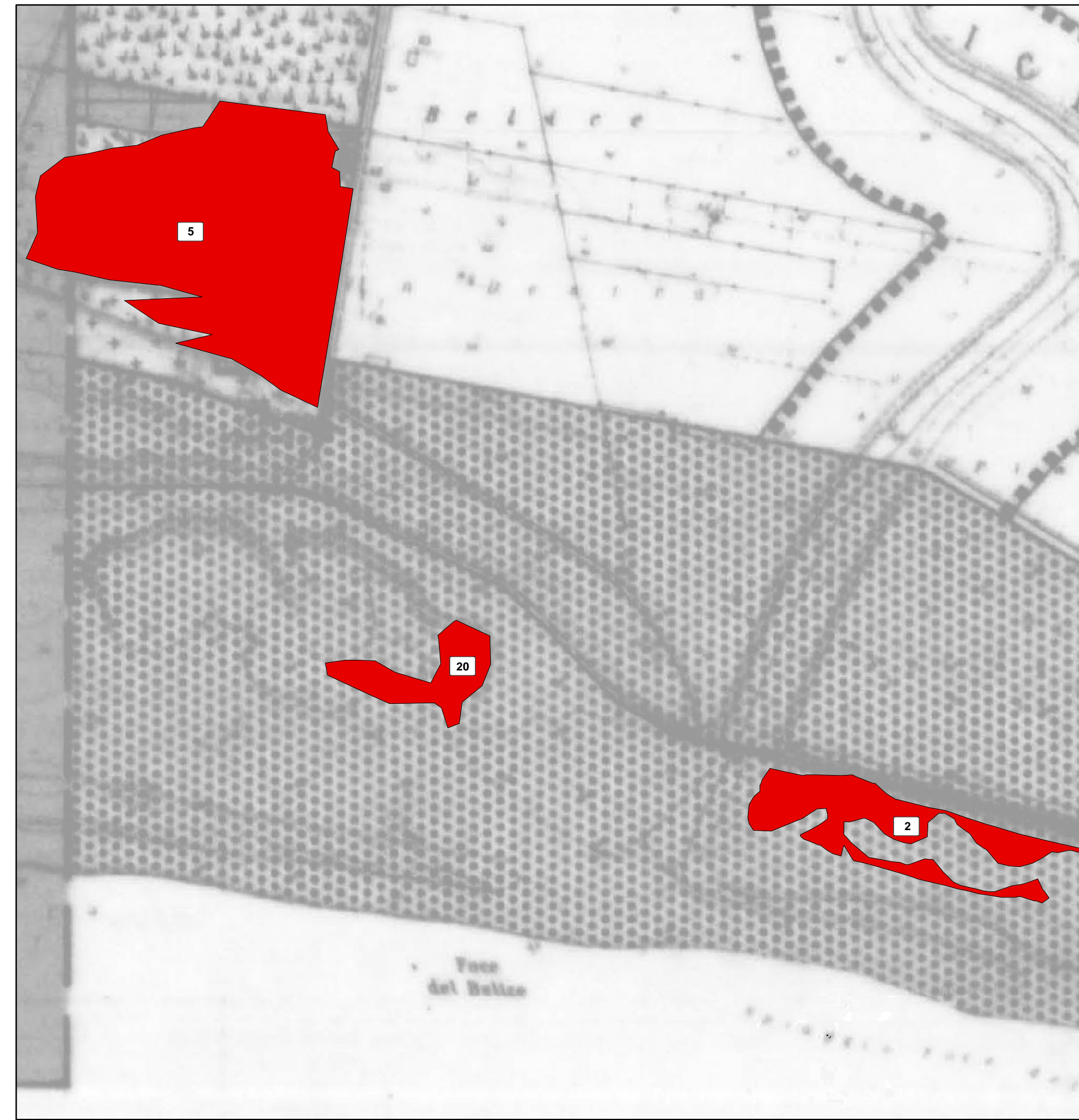
Area percorsa dal fuoco su Tav. 8.2 del P.R.G. vigente - Scala 1:5000