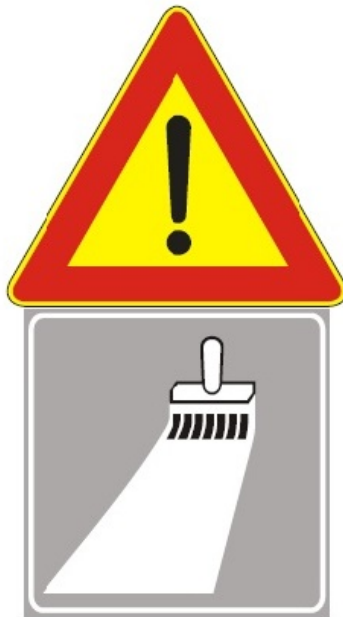
Figura Il 391 Art. 31