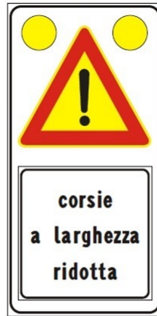
Figura Il 391c Art. 31