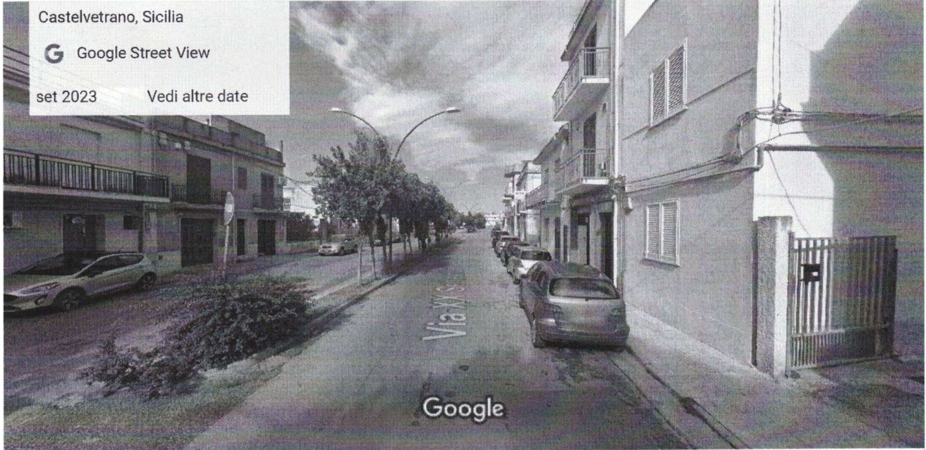
Data dell'immagine: set 2023